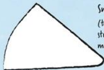
Snavel (teken hier straks een mondje in)

(houd deze wit en teken er straks pupillen in)